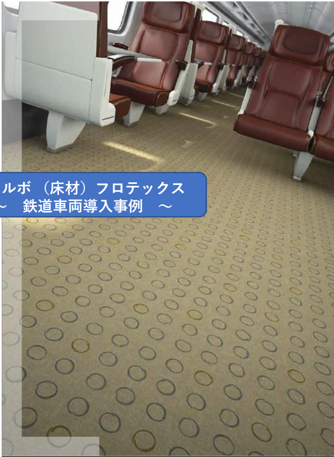
フォルボ（床材）フロテックス ～ 鉄道車両導入事例 ～